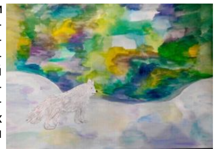
«Арктическое чудо». Живопись (гуашь). Арина Кондратьева