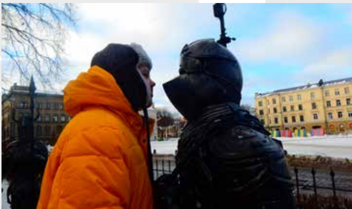
ОДИН НА ОДИН