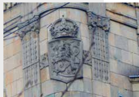
ЗДАНИЕ НАЦИОНАЛЬНОГО АКЦИОНЕРНОГО БАНКА