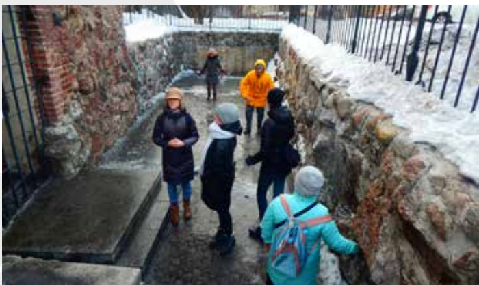
СПУСТИЛИСЬ В 15-Й ВЕК