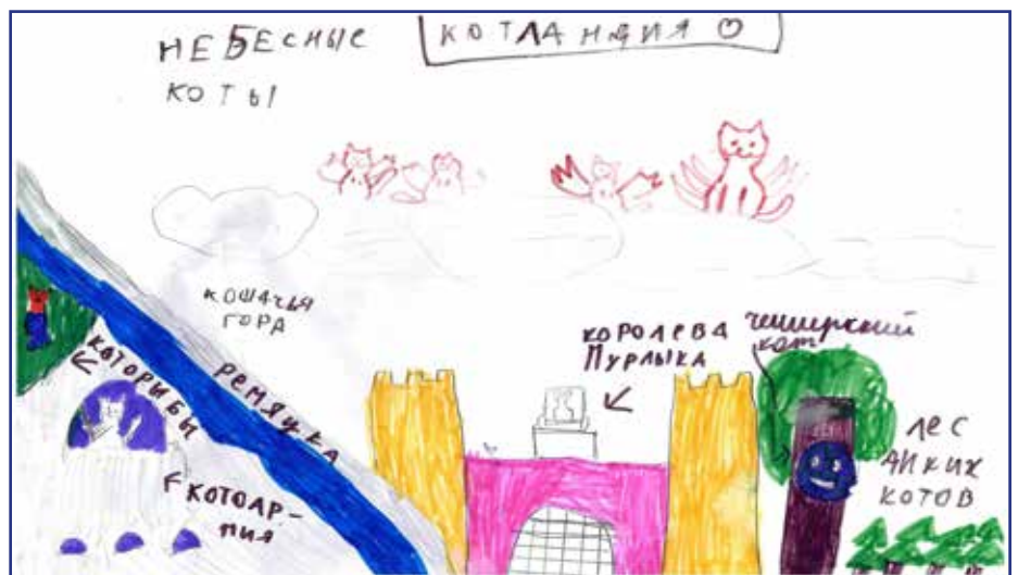
Котландия Таисии Белостоцкой, 5А