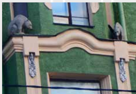
4 ПРИРОДА КАРЕЛИИ НА СТЕНАХ ГОРОДА

ВАРВАРА КИМ, 6А ФОТО ИЗ ДОМАШНЕГО АРХИВА