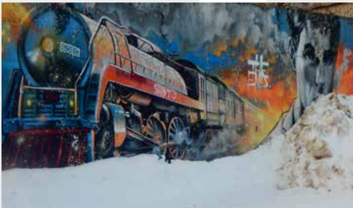
ПАРОВОЗ В МИФЛАНДИЮ

Редакция нашей газеты получила серьезное задание: искать мифы в современном мире. Где их найти? Куда отправиться? Решили проверить утверждение о том, что город наш - город мифов и легенд.