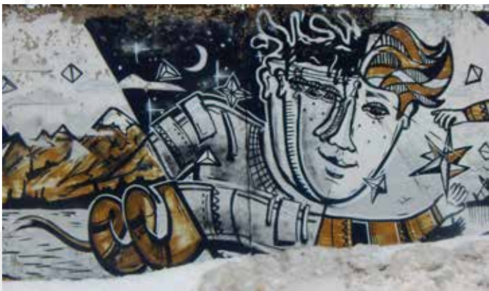
ГЕРОИ РЯДОМ С НАМИ